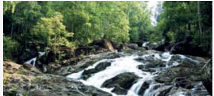
น้ำตกไพรวัลย์

การเดินทาง จากตัวเมืองพัทลุง ใช้ทางหลวงหมายเลข ๔๓ ถึงสามแยกเขาชัยสน เลี้ยวซ้ายไปตามทางหลวงหมายเลข ๔๐๔๑ ไปอำเภอเขาชัยสน เลี้ยวขวาไปตามทางหลวงชนบทเข้าสู่บ่อน้ำร้อนเขาชัยสน