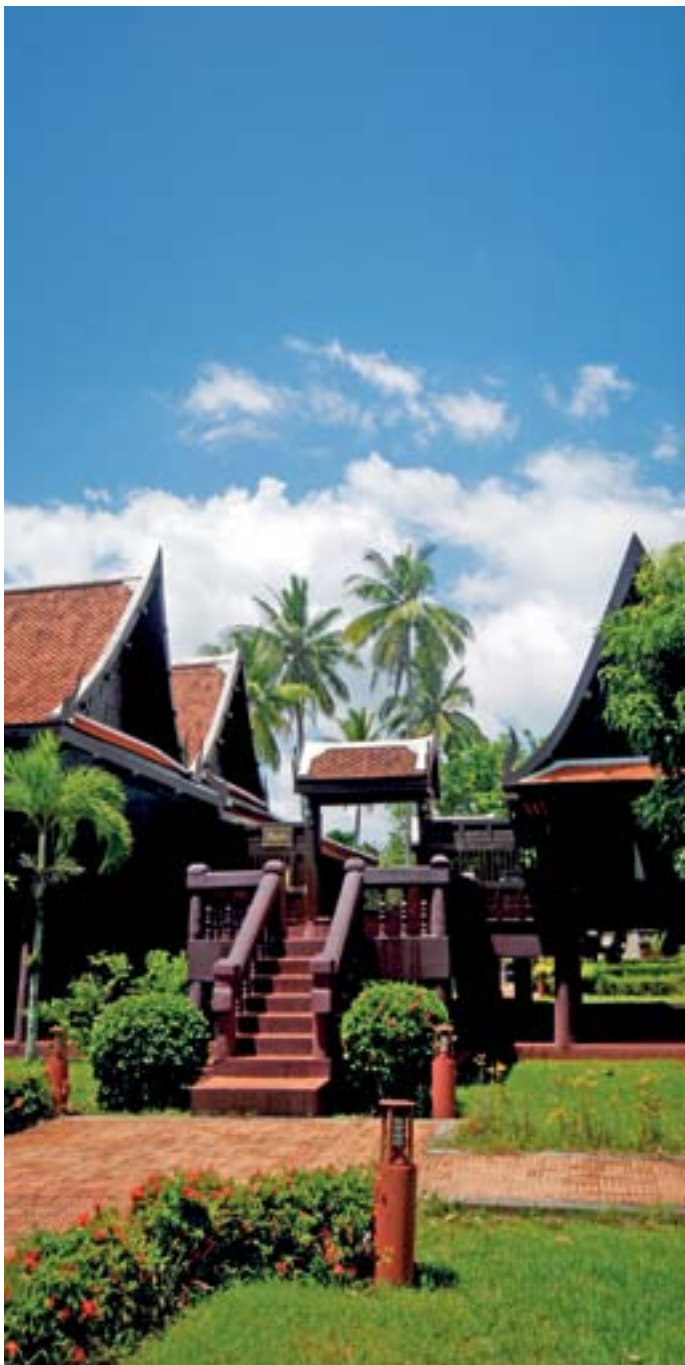
วังพัทลุง