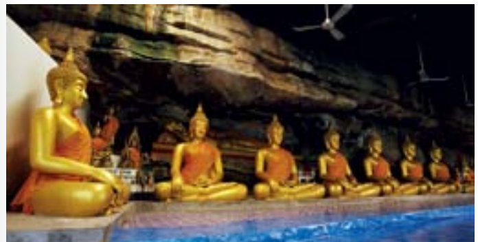
ถ้ำคูหาสวรรค์

หอโพนมงคล หอโพนมงคล ๙ ลูก ได้ติดตั้งตามจุดสำคัญๆ ในเขตเทศบาลเมืองพัทลุง เพื่อจะสืบสานเจตนารมณ์ของบรรพบุรุษชาวพัทลุง ประกอบด้วยจุดที่ ๑ วัดอินทราวาส (วัดท่ามีหว่า) ถนนรามเมศวร์ โพนก้องฟ้าจุดที่ ๒ สวนกาญจนาภิเษกถนนรามเมศวร์โพนพสุธาสนั้นจุดที่ ๓ หน้าพระพุทธนิรโรคันตรายชัยวัฒน์จตุรทิศ ถนนรามเมศวร์ โพนขวัญเมือง จุดที่ ๔ สวนสาธารณะเฉลิมพระเกียรติ ๘๐ พรรษา ถนนคูหาสวรรค์ โพนเรืองเดชา จุดที่ ๕ ลานหน้าเขาวังเนียง ถนนทัศนย์บำรุง โพนมหามงคลจุดที่ ๖ ศูนย์ภูมิปัญญาผู้สูงอายุ ถนนวิรัชคีร์ราษฎร์พัฒนา โพนมนต์เทวัญ จุดที่ ๗ สวนเฉลิมพระเกียรติ ร. ๙ ถนนรามเมศวร์ โพนอนันต์ชัย