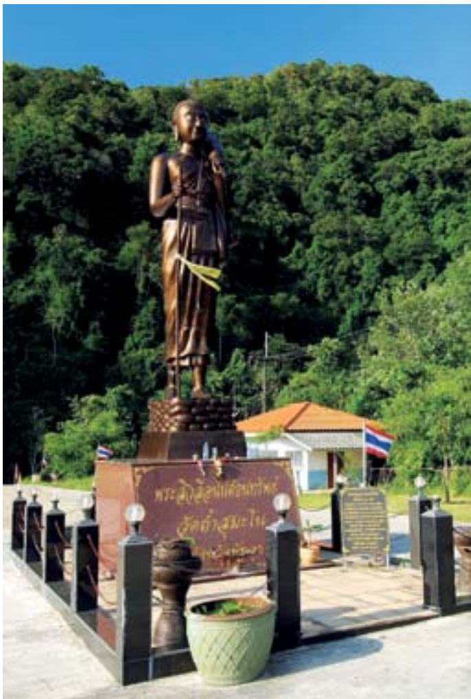
วัดถ้ำสุมะโน