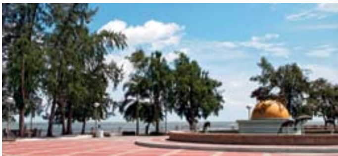
หาดแสนสุขลำปำ

เขตห้ามล่าสัตว์ป่าทะเลน้อย ได้รับการประกาศเป็นเขตห้ามล่าสัตว์ป่าทะเลน้อย เมื่อวันที่ ๑๙ กุมภาพันธ์ ๒๕๑๘ แต่ประชาชนมักเรียกกันว่า “อุทยานนกน้ำทะเลน้อย” ซึ่งนับเป็นเขตห้ามล่าสัตว์ป่าแห่งแรกของ