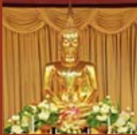
พระพุทธรูปโรคนครายชัยวัฒนังครุทิศ