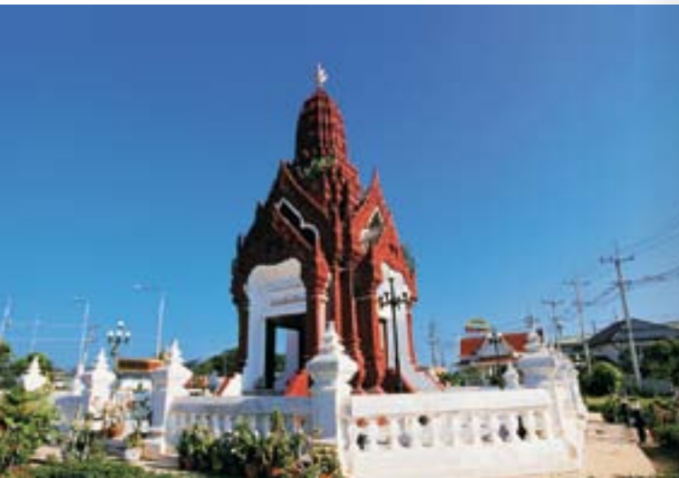
ศาลหลักเมือง

หลักชัยและหลักใจของประชาชนชาวอ่างทองอย่างยิ่ง ผู้ที่มีโอกาสไปเยือนจังหวัดนี้ไม่ควรพลาดการไปเคารพสักการะศาลหลักเมืองแห่งนี้