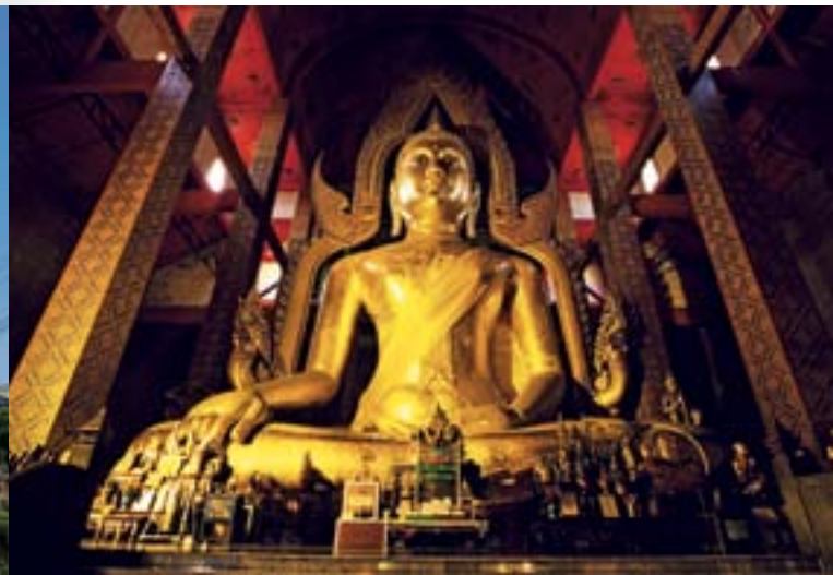
วัดต้นสน

วัดต้นสน อยู่ฝั่งตะวันตกของแม่น้ำเจ้าพระยาตรงข้ามกับวิทยาลัยเทคนิคอ่างทอง เป็นวัดเก่าแก่โบราณ เป็นที่ประดิษฐานพระพุทธรูปปางสะดุ้งมาร พระนามว่า สมเด็จพระพุทธนวลโลกุตตรธัมมบดีศรีเมืองทอง