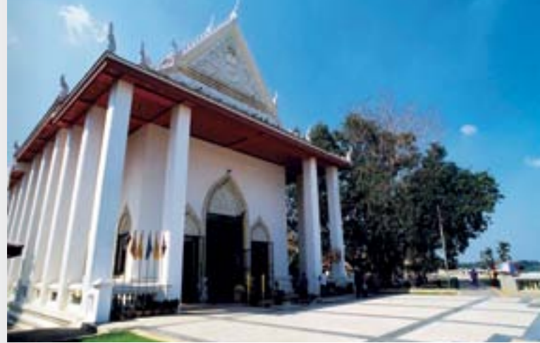
วัดไชโยวรวิหาร

วัดไชโยวรวิหาร หรือ วัดเกษไชโย ห่างจากอำเภอเมืองอ่างทองประมาณ ๑๘ กิโลเมตร อยู่บนเส้นทางสายอ่างทอง-สิงห์บุรี ด้านตะวันตกของแม่น้ำเจ้าพระยา เป็นพระอารามหลวงชั้นโท ชนิดวรวิหาร เดิมเป็นวัดราษฎร์สร้างมาแต่ครั้งใดไม่ปรากฏ มีความสำคัญขึ้นมาในสมัยรัชกาลที่ ๔ เมื่อสมเด็จพระพุทธเจ้าอยู่หัว (โต พรหมรังสี) แห่งวัดระฆังโฆสิตาราม ธนบุรี ได้ขึ้นมาสร้างพระพุทธรูปปางสมาธิองค์ใหญ่หรือหลวงพ่อดโตไว้กลางแจ้ง องค์เป็นปูนขาวไม่ปิดทอง ต่อมาในสมัยรัชกาลที่ ๕ ได้เสด็จ มานมัสการและโปรดเกล้าฯ ให้ปฏิสังขรณ์วัดไชโยขึ้นเมื่อ พ.ศ. ๒๔๓๐ แต่แรงสั่นสะเทือนระหว่างการลงรากฐานพระวิหารทำให้องค์หลวงพ่อดโตพังลงมาจึงโปรดเกล้าฯ ให้สร้างหลวงพ่อดโตขึ้นใหม่ตามแบบหลวงพ่อดโต วัดกัลยาณมิตร มีขนาดหน้าตักกว้าง ๘ วา ๖ นิ้ว สูง (สุดยอดตรีศมีพระ) ๑๑ วา ๑ ศอก ๗ นิ้ว และพระราชทานนามว่า “พระมหาพุทธรูป” มีการจัดงาน