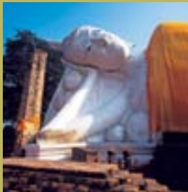
วัดขุนอินทประมูล