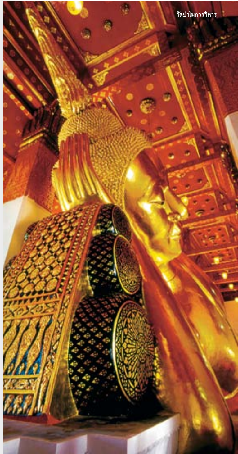
วัดป่าโมกวรวิหาร

วัดถนน ตั้งอยู่ที่ตำบลโฆงเฒ่า จากอำเภอป่าโมก ผ่านตลาด เทศบาลไปตามถนนสายป่าโมก-บางบาลสายใน (๓๕๐๑) กิโลเมตรที่ ๑๙-๒๐ ประมาณ ๗ กิโลเมตร ก็จะถึงวัดถนน วัดนี้สร้างราว พ.ศ. ๒๓๒๓ ในสมัยกรุงธนบุรี ภายในวัดมีพระยืนขนาดเท่าองค์จริงประดิษฐาน อยู่ในวิหารนามว่า “ หลวงพ่อพระพุทธรูปห้าพัน ” เป็นพระพุทธรูปแกะด้วยไม้ องค์ยืน สูง ๒ เมตรกว่า ประดิษฐานไว้ มีเปลวลอยน้ำมาหน้าวัดและไมยอม