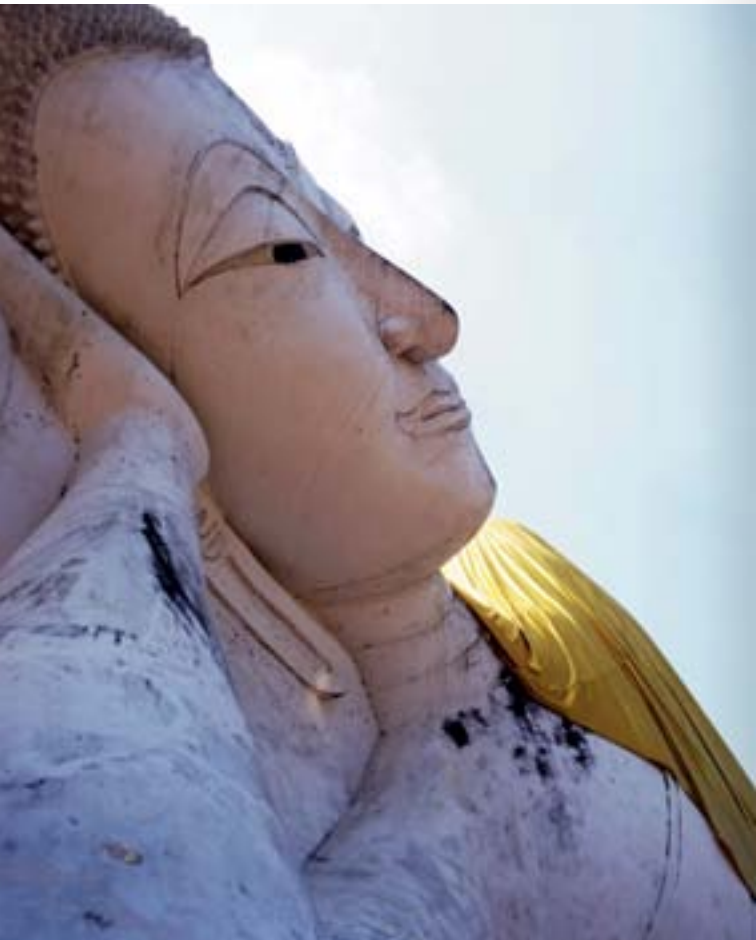
พระนอน วัดชุนอินทประมูล