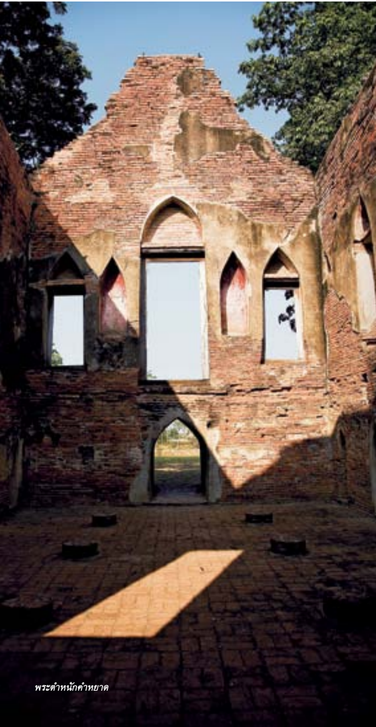
พระตำหนักคำหยาด

ในคราวที่พระบาทสมเด็จพระจุลจอมเกล้าเจ้าอยู่หัว เสด็จทอดพระเนตรพระตำหนักคำหยาด เมื่อ พ.ศ. ๒๔๕๑ ได้เสด็จฯ มายังโบราณสถานแห่งนี้และทรงมีพระราชวินิจฉัยตั้งปรากฏในพระราชหัตถเลขาบรรณนิยายเรื่องเสด็จฯ ลำน้ำมะขามเต่าไว้ว่า เดิมที่ทรงมีพระราชดำริว่า กรมขุนพรพินิต (ขุนหลวงหาวัด หรือเจ้าฟ้าอนุกรมพร) ทรงผนวชที่วัดโพธิ์ทองแล้วสร้างพระตำหนักแห่งนี้ขึ้นเพื่อจำพรรษาเนื่องจากมีชัยภูมิที่เหมาะสม ครั้นได้ทอดพระเนตรเห็นตัวพระตำหนักสร้างด้วยความประณีตสวยงามแล้วพระราชดำริเดิมก็เปลี่ยนไป ด้วยทรงเห็นว่า ไม่น่าที่ขุนหลวงหาวัดจะทรงมีความคิดใหญ่โต สร้างที่ประทับชั่วคราวหรือที่มั่นในการต่อสู้ให้ดูสวยงามเช่นนั้น ดังนั้น จึงทรงสันนิษฐานว่าพระตำหนักนี้คงจะสร้างขึ้นตั้งแต่รัชสมัยสมเด็จพระเจ้าบรมโกศเพื่อเป็นที่ประทับแรมเช่นเดียวกับที่พระเจ้าปราสาททองทรงสร้างที่ประทับไว้ที่บางปะอินเนื่องจากมีพระราชนิมิตเสด็จประพาสเมืองแถบนี้ ทั้งพระองค์ได้เสด็จฯ พระนอนขุนอินทประมูลถึง ๒ ครั้ง และขณะเดียวกันที่กรมขุนพรพินิต (ขุนหลวงหาวัด หรือเจ้าฟ้าอนุกรมพร) ผนวชอยู่ที่วัดราชประดิษฐ์ก็ได้ทรงนำข้าราชการบริวารกับพระภิกษุที่จงรักภักดีต่อพระองค์ เสด็จฯ ลงเรือพระที่นั่งออกจากพระนครศรีอยุธยามาจำพรรษาที่วัดโพธิ์ทองคำหยาดและประทับอยู่ที่พระตำหนักคำหยาดนี้ เพื่อไปสมทบกับชาวบ้านบางระจัน ปัจจุบันนี้กรมศิลปากรได้บูรณะ และขึ้นทะเบียนพระตำหนักคำหยาดเป็นโบราณสถานไว้แล้ว