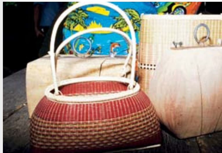
ผลิตภัณฑ์จากไม้ไผ่

ภายในหมู่บ้านมีพิพิธภัณฑ์เครื่องใช้ไม้ไผ่ แสดงอุปกรณ์เครื่องใช้พื้นบ้านต่าง ๆ ที่ผลิตจากไม้ไผ่และมีเก็บรวบรวมเอาไว้ นอกจากนี้ที่บางเจ้าฉ่ายังมีบริการรถอีแต่นชมวิถีชีวิตริมน้ำน้อย กิจกรรมชมแหล่งท่องเที่ยวเชิงเกษตร สวนมะม่วง สวนมะยมชิต และสวนกระท้อน ฯลฯ ชมแหล่งท่องเที่ยวในอำเภอใกล้เคียง อำเภอโพธิ์ทอง อำเภอไชโย และอำเภอแสวงหา มีบ้านพักโฮมสเตย์ไว้คอย