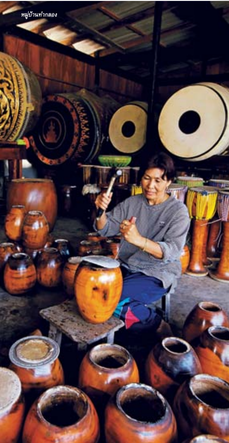
หมู่บ้านท่ากลอง

ลอยน้ำต่อไป พระทองอยู่ซึ่งเป็นเจ้าอาวาสในสมัยนั้น ลงไปดูพบว่าในแพมีพระทำด้วยไม้แกะสลัก ต้องทำพิธีบวงสรวงอัญเชิญพระแกะสลักองค์นี้ขึ้นมา คนที่ไปกราบไหว้บูชาจะเสี่ยงโชค ขอพรให้ตั้งไข่ที่หน้าหลวงพ่อก ถ้าใครตั้งไข่ได้ แสดงว่ามีโชคลาก ดวงดี ถ้าใครตั้งไข่ไม่ได้ก็แสดงว่าไม่มีดวง ถ้าจะแก้บนสิ่งที่ทำนายคือให้แก้บนด้วยไข่ต้มละคร และพวงมาลัย นอกจากนี้ยังมีสิ่งที่น่าสนใจคือ รอยพระพุทธรบาทลอยฟ้า ซึ่งแกะสลักด้วยไม้ติดอยู่บนเพดานศาลาการเปรียญ มีขนาดกว้าง ๓๐ นิ้ว ยาว ๗๐ นิ้ว อยู่นับร้อยปี