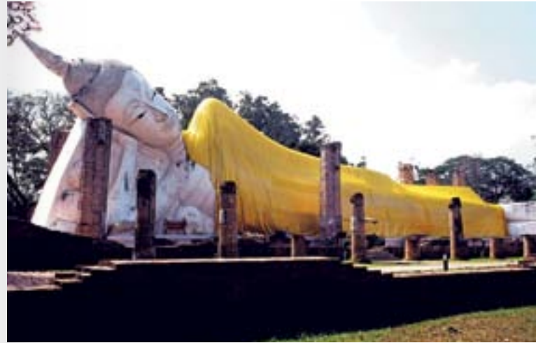
วัดขุนอินทประมูล

นอกจากนี้ภายในบริเวณวัดขุนอินทประมูลยังมีซากโบราณสถาน วิหารหลวงพ่อขาว ซึ่งเหลือเพียงฐาน ผนังบางส่วนและองค์พระพุทธรูป และใน ศาลาเอนกประสงค์ มีศาลูปูนหินปูนอินทประมูลและโครงการอุทกมุนษย์ ขุดพบในเขตวิหารพระพุทธรูปไสยาสน์เมื่อปี พ.ศ. ๒๕๔๑ ลักษณะนอนคว่ำหน้า