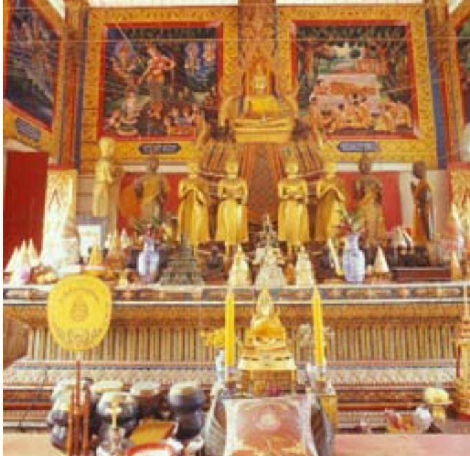
วัดบวรวิญ

มีเส้นทางเดินศึกษาธรรมชาติและทอดูนก รายละเอียดติดต่อที่สำนักงานเขตท่ามลำลำสัตว์ป่าวัดไผ่ล้อมและวัดอัมพวันราม โทร. ๐ ๒๙๙๗๙ ๘๖๗๗