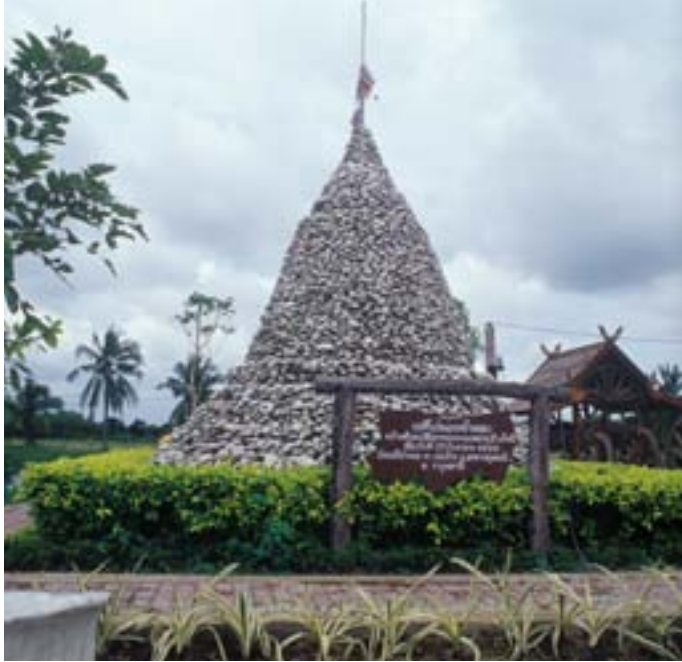
วัดเจติยโทย

ลานเอนกประสงค์ เป็นส่วนจัดกิจกรรม มีพื้นที่ ๓,๕๐๐ ตารางเมตร อาคารทั้ง ๔ อาคารในหอจดหมายเหตุแห่งชาติแห่งนี้ ทางกรมศิลปากร ต้องการให้เป็นหอสมุดจดหมายเหตุแห่งชาติที่สมบูรณ์ที่สุด ในการเก็บรวบรวมเอกสารสำคัญของชาติเกี่ยวกับพระราชประวัติและพระราชกรณียกิจในพระบาทสมเด็จพระเจ้าอยู่หัวภูมิพลอดุลยเดชและพระบรมวงศานุวงศ์ เพื่อให้เป็นศูนย์กลางในการศึกษา ค้นคว้า วิจัยให้แก่หน่วยงานราชการ เอกชน นิสิต นักศึกษาและประชาชนทั่วไป อำนวยประโยชน์ในการรวบรวมจัดเก็บจัดแสดง ให้บริการสืบค้นและอนุรักษ์เอกสารที่เกี่ยวข้องในพระราชประวัติและพระราชกรณียกิจ อาทิ พระราชหัตถเลขา พระบรมราชาบาท พระราชดำรัส พระราชนิพนธ์ ภาพเขียนฝีพระหัตถ์ พระบรมฉายาลักษณ์ แถบบันทึกพระสุรัสวดี ฯลฯ ตลอดจนเอกสารการดำเนินงานตามโครงการอันเนื่องมาจากพระราชดำริ และโครงการเฉลิมพระเกียรติต่างๆ หอจดหมายเหตุแห่งชาติแห่งนี้จึงเป็นสถานที่ให้ความรู้ และให้เยาวชนรุ่นหลังได้ซาบซึ้งถึงพระปรีชาสามารถในการปกครองแผ่นดิน รวมไปถึงความ