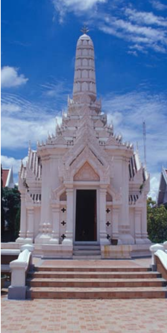
ศาลหลักเมือง