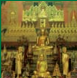
วัดชินวราราม