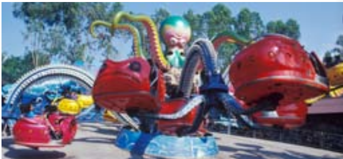
สวนสนุกดรีมเวิลด์

สวนสนุกดรีมเวิลด์ ตั้งอยู่ที่ตำบลบึงยี่โถ ดรีมเวิลด์เป็นสวนสนุกและสถานที่พักผ่อนที่รวบรวมความบันเทิงนานาชนิดเข้าไว้ด้วยกันในเนื้อที่กว่า ๑๖๐ ไร่ ประกอบด้วยดินแดนต่างๆ ๔ ดินแดน ซึ่งได้รับการออกแบบให้มีบรรยากาศแห่งความสุข สนุกสนานที่แตกต่างกันออกไป ได้แก่ ดรีมเวิลด์ ฟลาซ่า ดินแดนที่เต็มไปด้วยความดงามของสถาปัตยกรรมอันวิจิตรพิสดารตลอดสองข้างทาง ดรีมการ์เด็น เป็นอุทยานสวนสวยที่ถูกจัดไว้อย่างสวยงามท่ามกลางความเย็นสบายจากทะเลสาบขนาดใหญ่และเคเบิลคาร์ ที่จะพาชมความงามของทัศนียภาพในมุมสูง แฟนตาซีแลนด์ เป็นดินแดนแห่งเทพนิยาย ประกอบด้วย ปราสาทเจ้าหญิงนิทรา บ้านขนมปังและบ้านยักษ์ แอตแวนเจอร์ แลนด์ ดินแดนแห่งการผจญภัย และท่าทายประกอบด้วย รถไฟตะลุยจักรวาล ไวกิ้งส์ เมืองหิมะ เป็นต้น