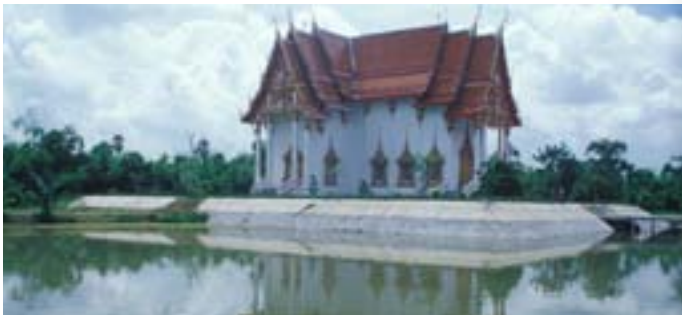
วัดไผ่ล้อม

และอวกาศ ปรากฏการณ์แห่งจักรวาล พร้อมสนุกสนานกับภาพยนตร์ เต็มโดม ๓๖๐ องศา เรื่อง Infinity Express และ Kaluoka'hina (ผู้พิทักษ์ท้องทะเล) กิจกรรมทดลองต่างๆ กระตุ้นให้เกิดการเรียนรู้ อย่างสนุกสนาน สัมผัสประสบการณ์ทางวิทยาศาสตร์ได้จริง เปิดให้เข้าชม ในวันอังคาร - วันอาทิตย์ เวลา ๐๙.๐๐ - ๑๖.๐๐ น. หยุดวันจันทร์และวันหยุดนักขัตฤกษ์ ไม่เสียค่าเข้าชม ยกเว้นค่าเข้าชมห้องฟ้าจำลอง ราคา ๓๐ บาท สอบถามรายละเอียดโทร. ๐ ๒๕๗๗ ๕๔๕๖-๙ ต่อ ๑๐๓ โทรสาร ๒๕๗๗ ๕๔๕๕ หรือ www.iscience.net