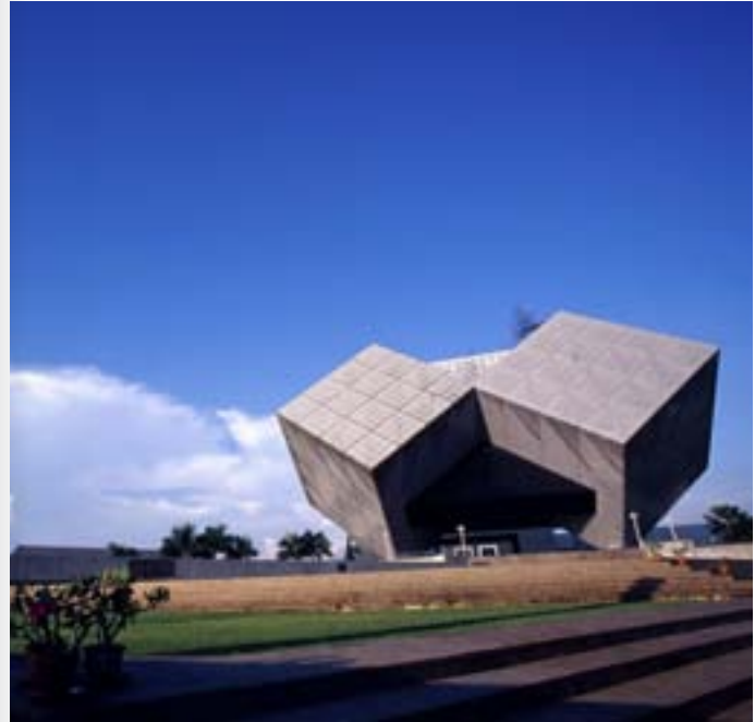
พิพิธภัณฑ์วิทยาศาสตร์

พิพิธภัณฑ์สถานเครื่องถ้วยเอเชียตะวันออกเฉียงใต้ ตั้งอยู่ภายในมหาวิทยาลัยกรุงเทพ วิทยาเขตรังสิต ตำบลคลองหนึ่ง ภายในจัดแสดงศิลปะโบราณวัตถุ เครื่องถ้วยที่ผลิตจากแหล่งเตาในประเทศไทย เช่น เครื่องถ้วยสุโขทัย เครื่องถ้วยล้านนาและเครื่องถ้วยอยุธยา รวมทั้งเครื่องถ้วยที่ผลิตจากเตาเผาในต่างประเทศ ซึ่งค้นพบในประเทศไทย อาทิ เครื่องถ้วยจีน เครื่องถ้วยเวียดนามและเครื่องถ้วยพม่า เป็นต้น พิพิธภัณฑ์แบ่งออกเป็นห้องนิทรรศการถาวร ห้องนิทรรศการชั่วคราว ร้านจำหน่ายหนังสือและสินค้าที่ระลึก เปิดให้เข้าชมวันอังคาร - วันเสาร์ ปิดวันอาทิตย์ วันจันทร์ และวันหยุดนักขัตฤกษ์ เวลา ๐๙.๐๐ - ๑๖.๐๐ น. สอบถามข้อมูลเพิ่มเติม โทร. ๐ ๒๙๐๒ ๐๒๙๙ ต่อ ๒๕๙๐ โทรสาร. ๐ ๒๕๑๖ ๖๑๑๕ หรือ http://museum.bu.ac.th อีเมลล์ museum@bu.ac.th