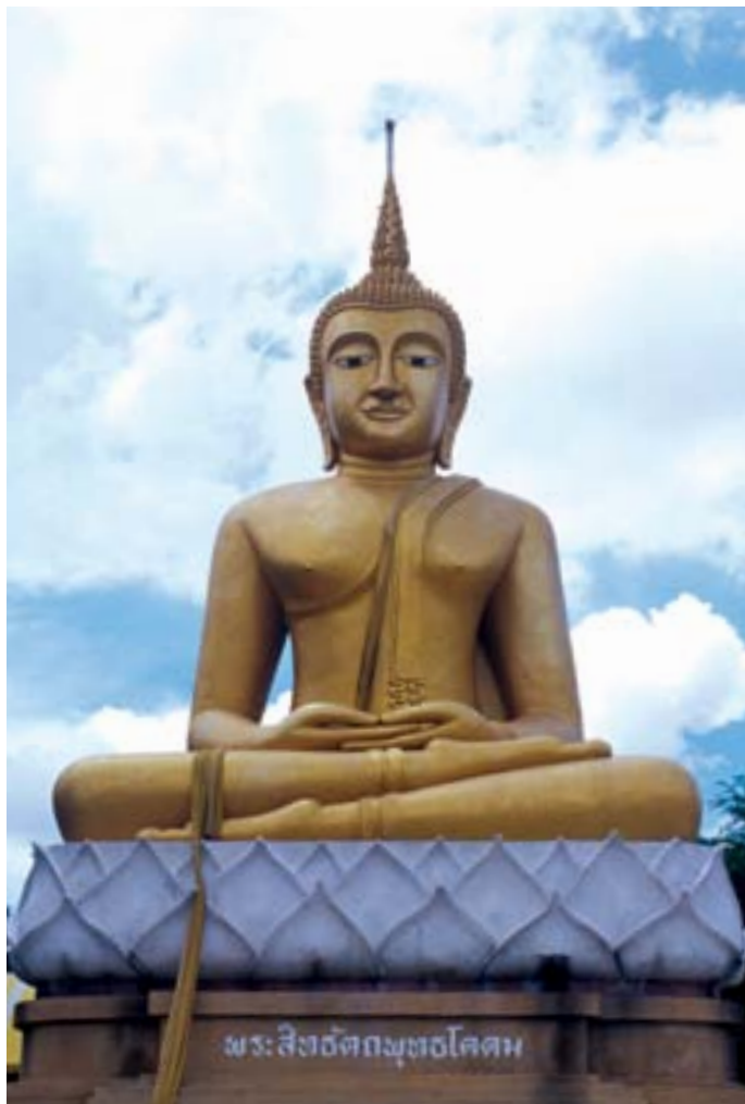
วัดเสด็จ